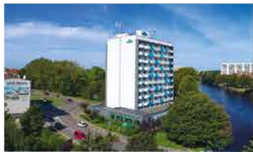
3+ Aparthotel Nad Parseta

Freizeit/Kur/Unterhaltung: Die Kur-Anwendungen erfolgen in den hauseigenen Behandlungsräumen. Es werden bspw. Moorpackungen, Bäder, Massagen und Inhalationen angeboten. Im Hotel befinden sich darüber hinaus ein kleines Schwimmbad (2 x 5 m, ca. 27°C), Whirlpool, Fitnessraum (kostenlose Nutzung) sowie eine Salzgrotte und eine finnische Sauna (jeweils gg. Gebühr).