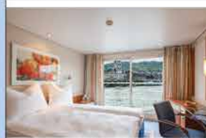
Kabinenbeispiel, 4++ CELINA