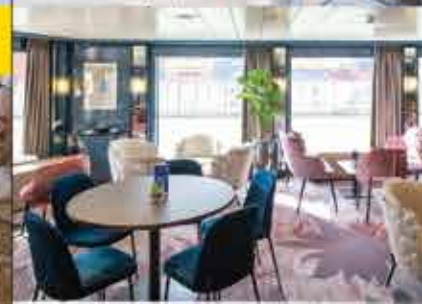
Panorama-Salon, 4++ CELINA