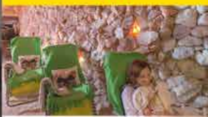
Salzgrotte, 3+ Aparthotel Nad Parseta