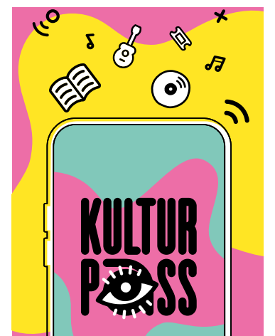
Grafik: kulturpass.de / BKM

Anleitungen und Hilfe erhalten interessierte Jugendliche unter: https://service.kulturpass.de/help/de-de/2-jugendliche .