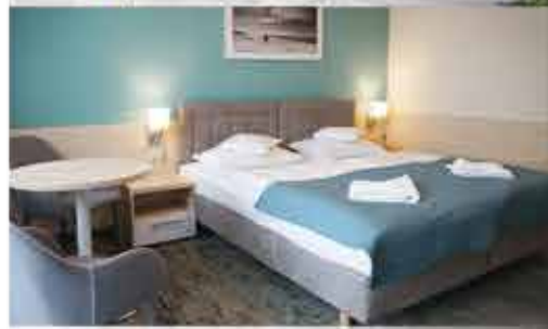
Zimmerbeispiel, 3+ Aparthotel Nad Parseta